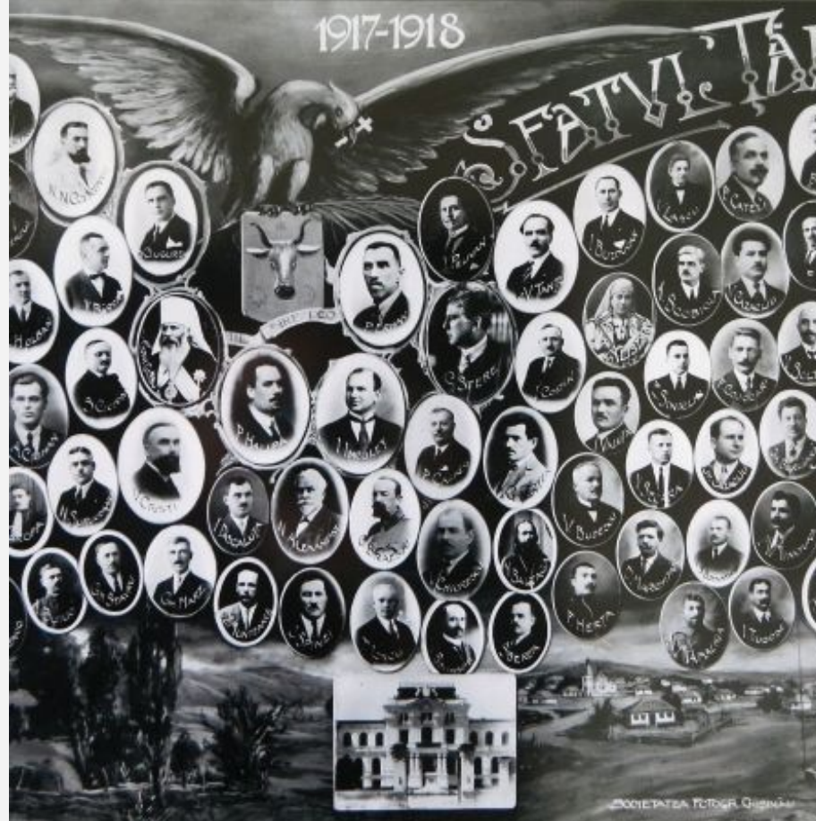
Membrii Sfatului Tarii care au votat unirea Republicii Democrate Federative Moldovenesti (Basarabia) cu Romania

Unirea Basarabiei cu România s-a făcut în condiții grele, deosebite. Luna aprilie 1917 a fost considerată, în Rusia, luna mitingurilor. Basarabia a organizat și ea, pe 6 și 7 aprilie 1917, un congres general al cooperativelor sătești care au cerut printr-o moțiune autonomia administrativă. Pe 18 aprilie (stil vechi) la Odessa, 10.000 de soldați moldoveni au cerut autonomia politică pentru Basarabia și dreptul de a se organiza în cohorte. Și congresul preoțimii basarabene va cere pe 19 și 20 aprilie la Chișinău alegerea unui mitropolit român, convocarea unei adunări naționale și constituirea unui "Înalt Sfat", cu atribuții legislative și executive. Citește mai departe »